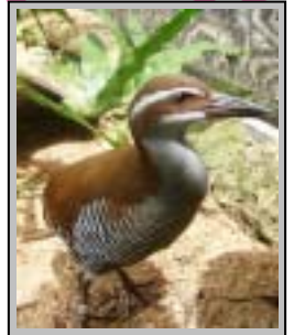
ココバード グアム島の鳥。飛べない鳥として知られ、近年は絶滅の危機に、ココロードレースの収益の一部はココバードの保護活動に使用されます