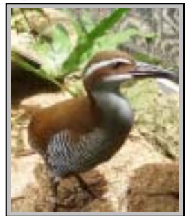
ココバード グアム島の鳥。飛べない鳥として知られ、近年は絶滅の危機に、ココロードレースの収益の一部はココバードの保護活動に使用されます